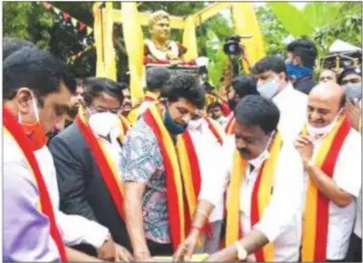
ಜಿಜಿಎಂಪಿ ಕೇಂದ್ರ ಕಚೇರಿ ಆವರಣದಲ್ಲಿ ಡಾ. ರಾಜಕುಮಾರ್ ಅವರ ಪುತ್ಥಳಿಯನ್ನು ನಟ ಶಿವರಾಜಕುಮಾರ್ ಉದ್ಘಾಟಿಸಿದರು.